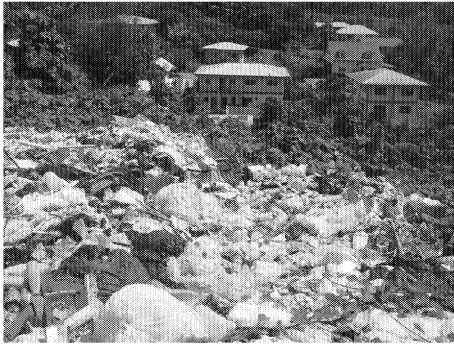
図1 アイライ州最終処分場