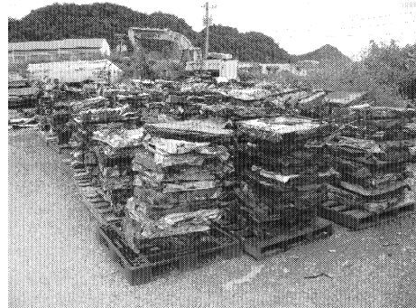
図4 M-Dock での分別の状況