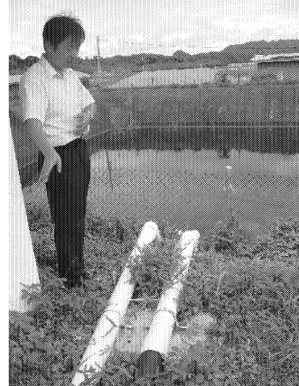
図6 M-Dock の酸化池と 処理水還元用パイプ