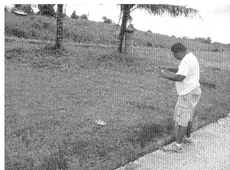
図8 M-Dock 周辺での調査