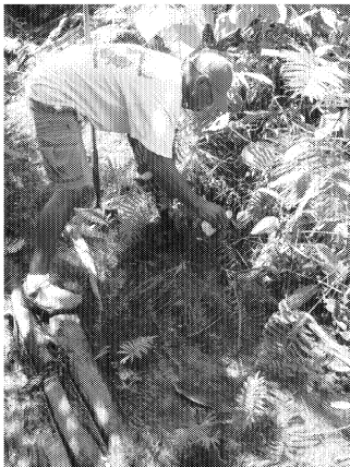
図5 アイライ処分場斜面での 浸出水採取の状況