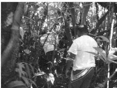
図7 アイライ処分場下流での調査