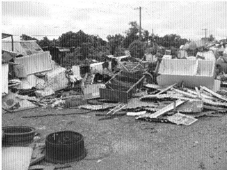
図3 M-Dock での分別の状況